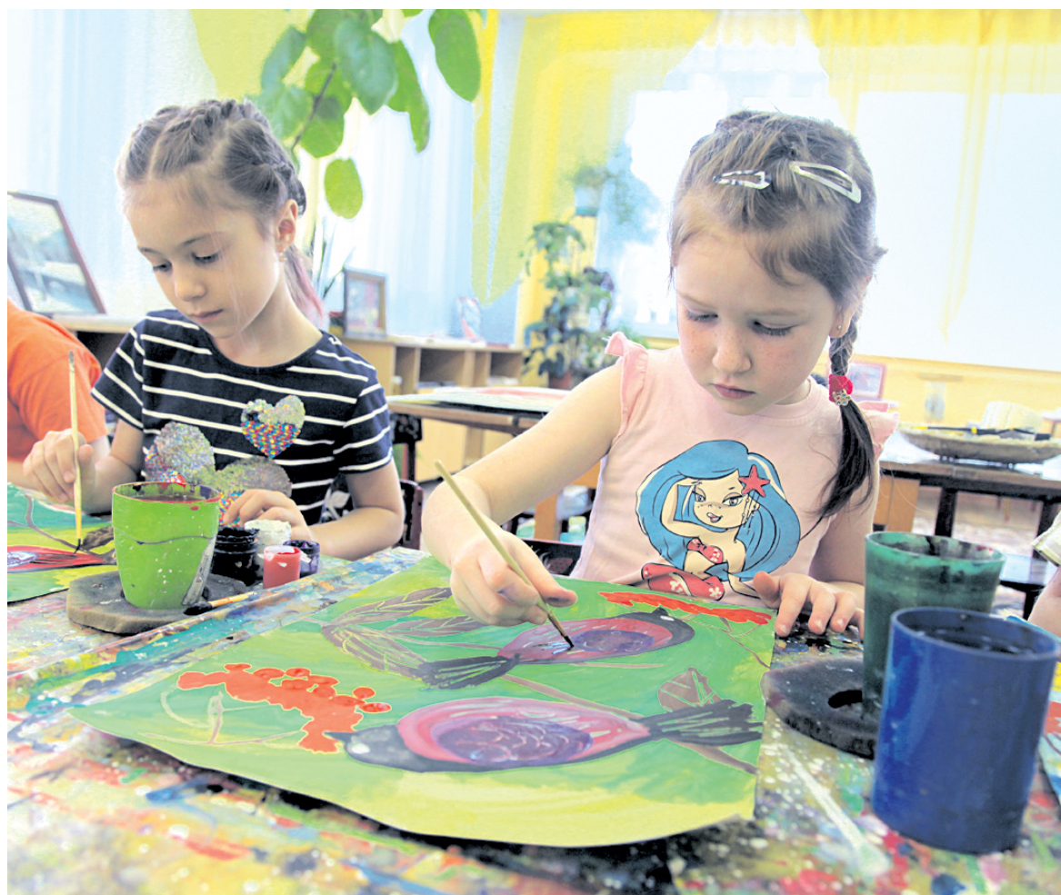
Когда дети любят рисовать, они вырастают творческими и позитивными людьми.