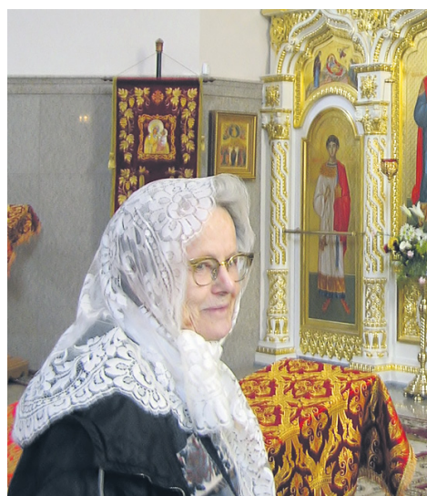
Маркиза в суровом городе. Удивительные истории