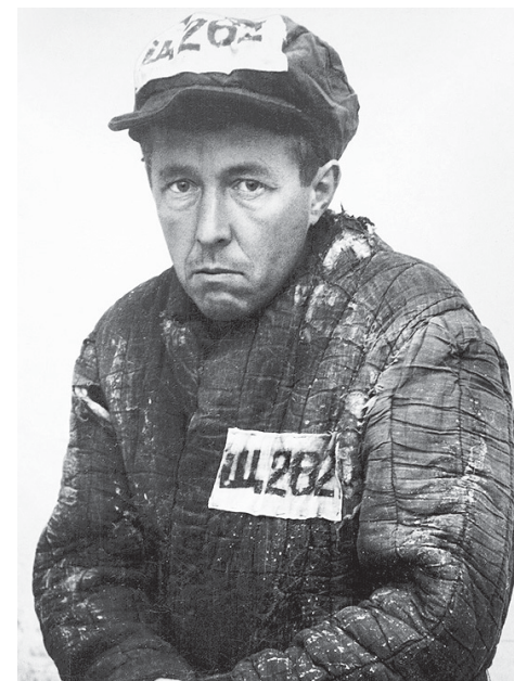
Александр Солженицын в лагере.

Впрочем, из «Архипелага» мы знаем, что интеллигентность – совсем не обязательно хлипкость. И «блатным», и дурным начальникам иногда и Укропы Помидоровичи (как называли ин-