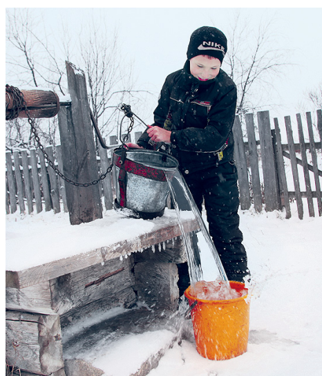
На краю. Как живут люди в самом северном поселке области