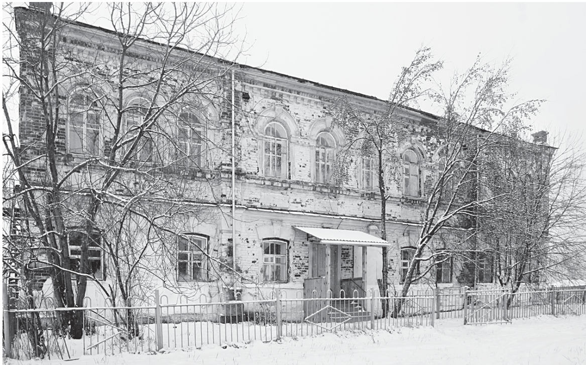
В бывшем банке теперь детский сад и фельдшерский пункт.