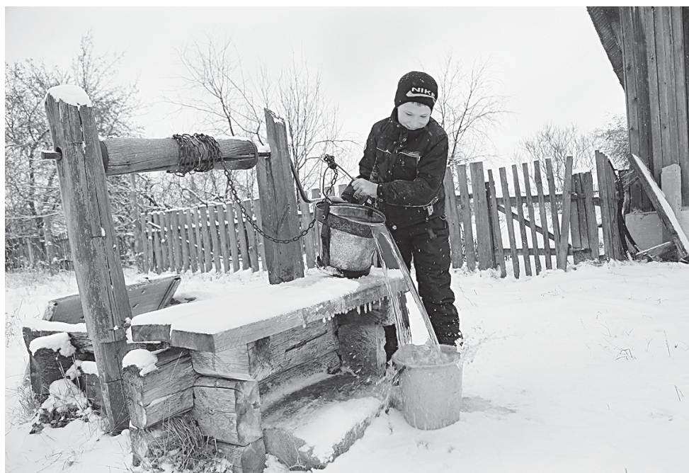
Принести воды из колодца – обычное для тиминских ребят занятие.

Удивительные люди жили когда-то в Тимино. Один из них – священник местного храма Леонид Смородинцев – оставил о себе крепкую память. Именно он построил два самых красивых здания в селе: земскую школу и банк. Да-