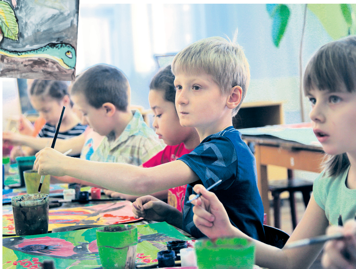
Настоящий художник наблюдателен и усидчив.