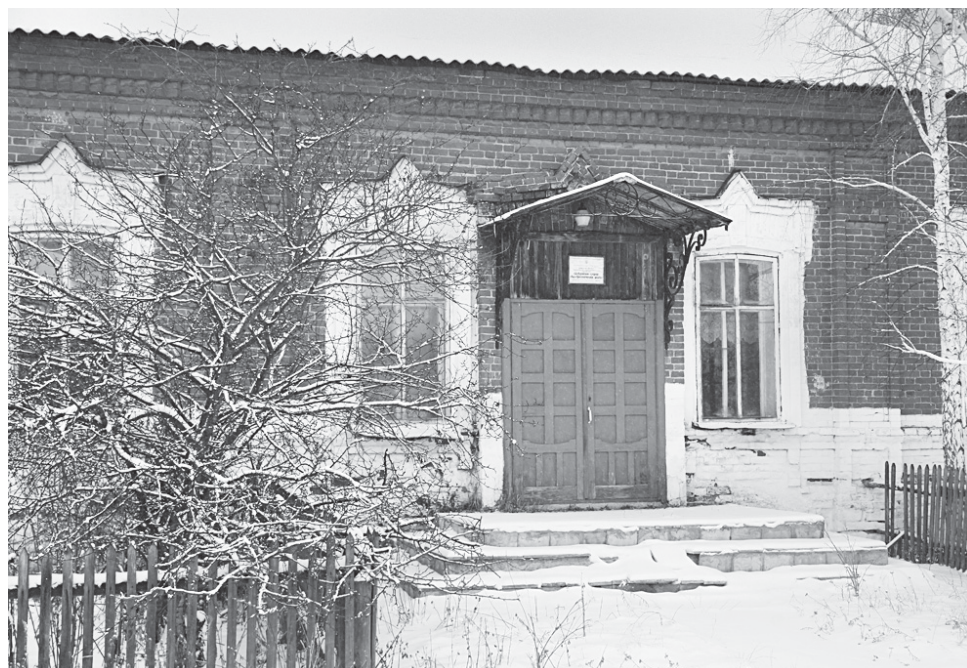
В 2021 году тиминская школа отметит 150-летие.