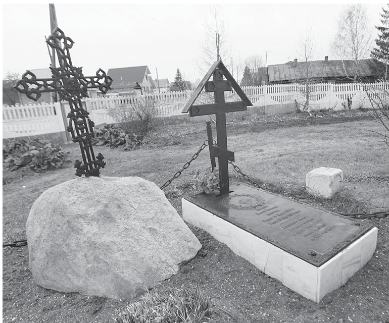
Могилы священников в ограде храма.