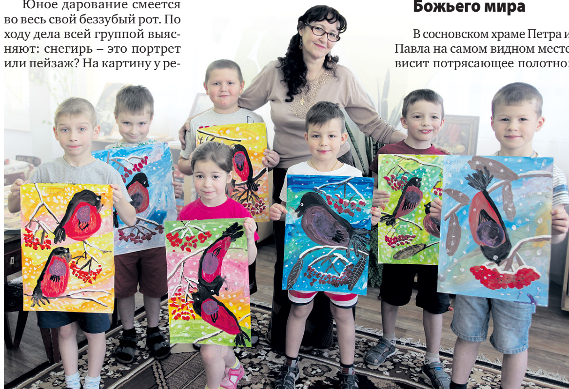
Два урока дети рисовали такую красоту.

В сосновском храме Петра и Павла на самом видном месте висит потрясающее полотно: