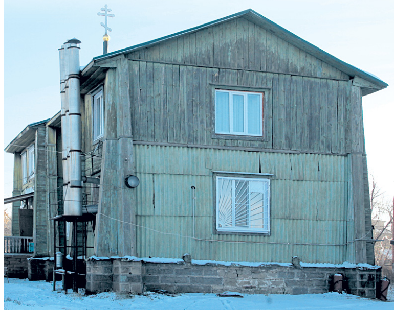
Старинный храм Петра и Павла, построенный казаками.