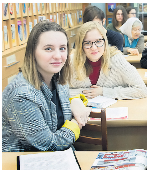
Рождественские чтения-2018. Самое главное